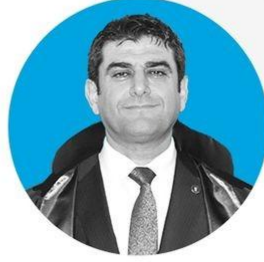
Av. Semih Gökayaz Adana Barosu Başkanı